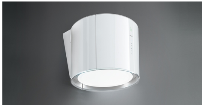
Poglądowe zdjęcie produktu Zdjęcie może dokładnie nie odpowiadać wybranej wersji