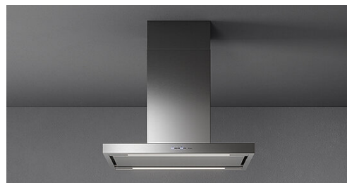
Poglądowe zdjęcie produktu. Zdjęcie może dokładnie nie odpowiadać wybranej wersji.