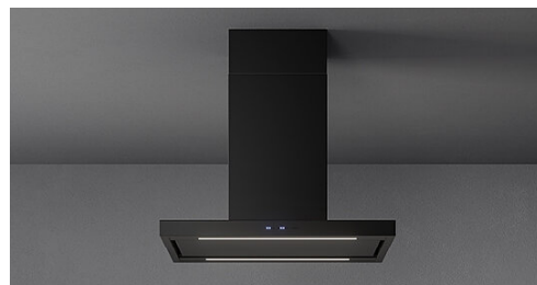
Poglądowe zdjęcie produktu. Zdjęcie może dokładnie nie odpowiadać wybranej wersji.