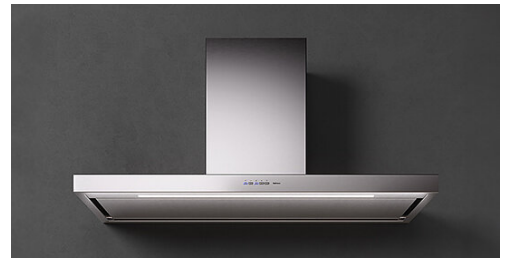
Poglądowe zdjęcie produktu. Zdjęcie może dokładnie nie odpowiadać wybranej wersji.