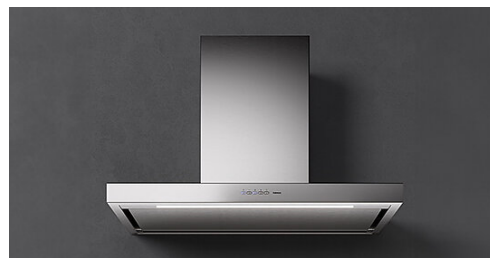
Poglądowe zdjęcie produktu. Zdjęcie może dokładnie nie odpowiadać wybranej wersji.