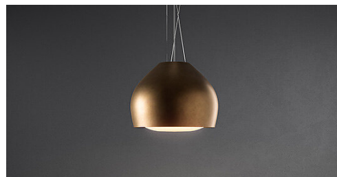
Poglądowe zdjęcie produktu. Zdjęcie może dokładnie nie odpowiadać wybranej wersji.