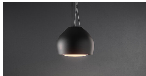
Poglądowe zdjęcie produktu. Zdjęcie może dokładnie nie odpowiadać wybranej wersji.