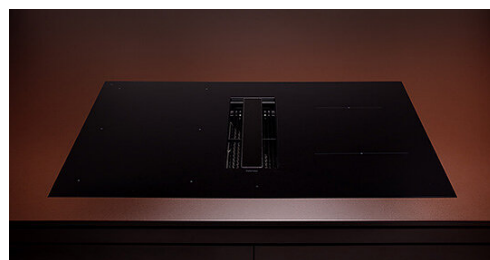
Poglądowe zdjęcie produktu. Zdjęcie może dokładnie nie odpowiadać wybranej wersji.