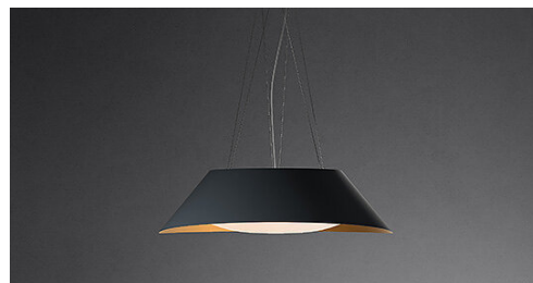
Poglądowe zdjęcie produktu. Zdjęcie może dokładnie nie odpowiadać wybranej wersji.