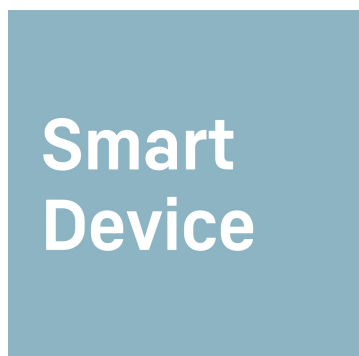
Zintegrowany moduł SmartDeviceBox

Chcesz zachować jak najdłużej świeżość delikatnego filetu jagnięcego lub świeżego mleka? Do tego służą komory BioFresh-Safe: W pojemniku „Meat & Dairy-Safe” panuje temperatura bliska 0 °C – idealne warunki przechowywania także dla najdelikatniejszych artykułów spożywczych. I najlepsze: wszystko jest ustawione fabrycznie, aby można było od razu rozpocząć korzystanie – w celu zachowania dłuższej świeżości.