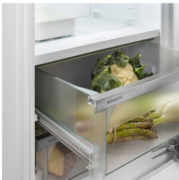
Fruit & Vegetable-Safe

Chcesz w sposób profesjonalny chłodzić owoce i warzywa? HydroBreeze to coś dla Ciebie: zimna mgiełka, potoczona z temperaturą w pojemniku Safe nieco powyżej 0 °C daje artykułom spożywczym dodatkowy impuls, zapewniający dłuższą trwałość. A przy tym daje optyczny efekt wow! Funkcja HydroBreeze włącza się co 90 minut na 4 sekundy oraz na 8 sekund w przypadku otwarcia drzwi.