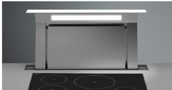
Poglądowe zdjęcie produktu Zdjęcie może dokładnie nie odpowiadać wybranej wersji