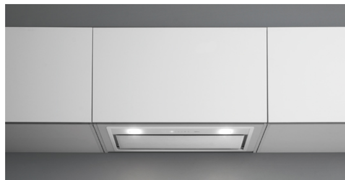
Poglądowe zdjęcie produktu Zdjęcie może dokładnie nie odpowiadać wybranej wersji