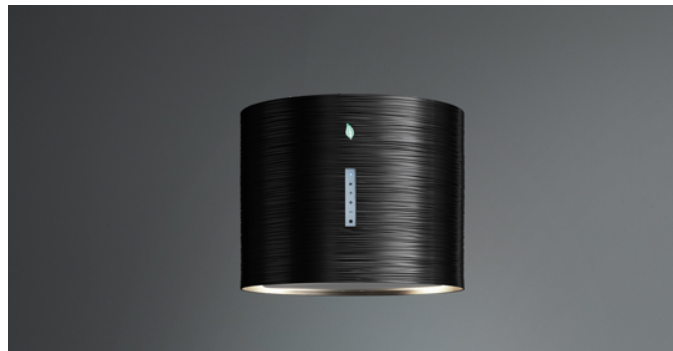
Poglądowe zdjęcie produktu Zdjęcie może dokładnie nie odpowiadać wybranej wersji