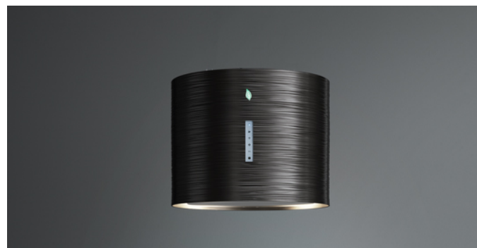
Poglądowe zdjęcie produktu Zdjęcie może dokładnie nie odpowiadać wybranej wersji