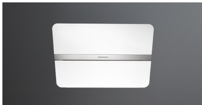
Poglądowe zdjęcie produktu Zdjęcie może dokładnie nie odpowiadać wybranej wersji