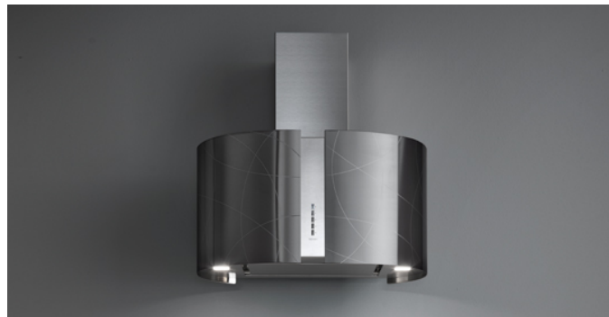
Poglądowe zdjęcie produktu Zdjęcie może dokładnie nie odpowiadać wybranej wersji