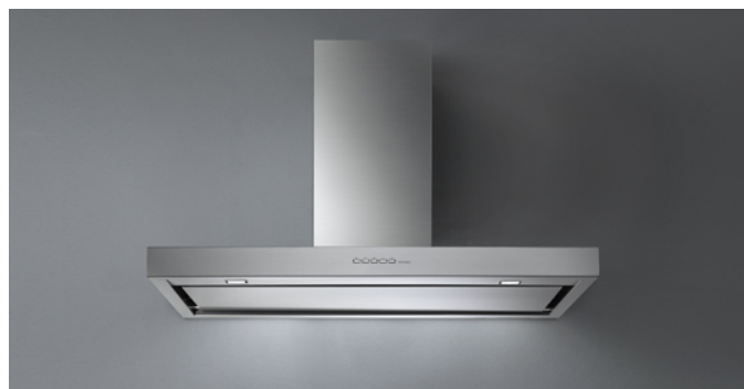
Poglądowe zdjęcie produktu Zdjęcie może dokładnie nie odpowiadać wybranej wersji