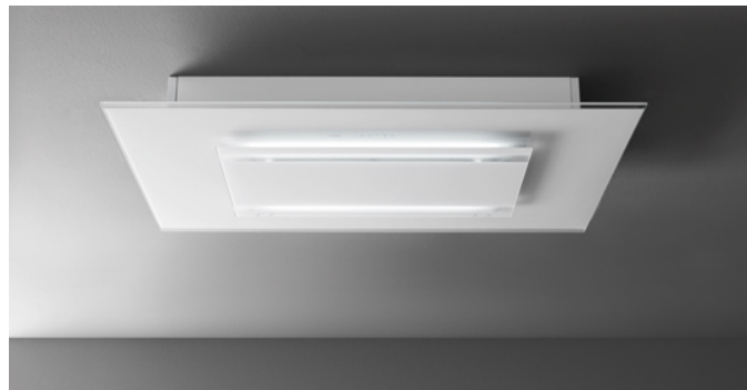
Poglądowe zdjęcie produktu Zdjęcie może dokładnie nie odpowiadać wybranej wersji