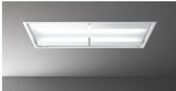
Poglądowe zdjęcie produktu

Zdjęcie może dokładnie nie odpowiadać wybranej wersji