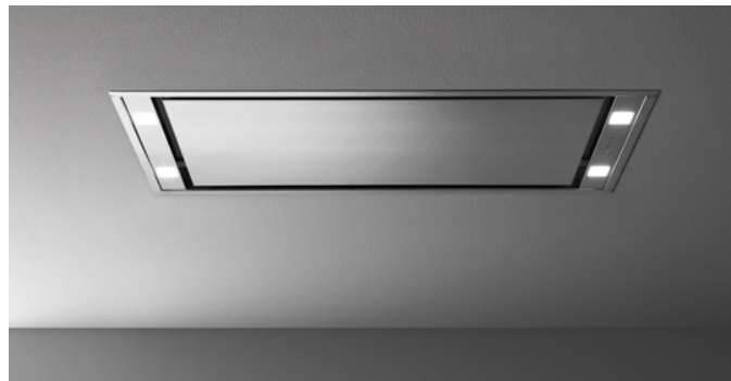
Poglądowe zdjęcie produktu

Zdjęcie może dokładnie nie odpowiadać wybranej wersji