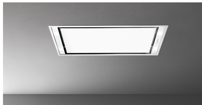
Poglądowe zdjęcie produktu

Zdjęcie może dokładnie nie odpowiadać wybranej wersji