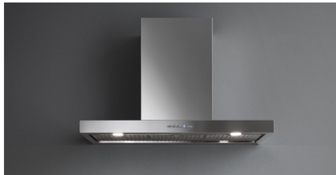
Poglądowe zdjęcie produktu Zdjęcie może dokładnie nie odpowiadać wybranej wersji