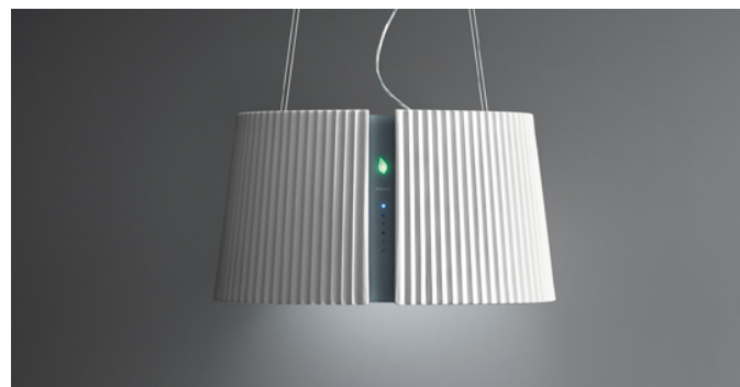
Poglądowe zdjęcie produktu Zdjęcie może dokładnie nie odpowiadać wybranej wersji