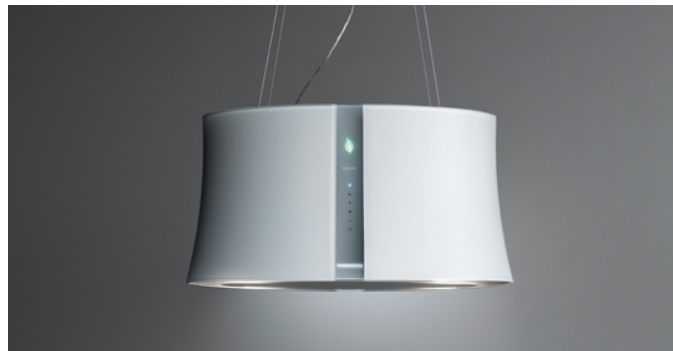
Poglądowe zdjęcie produktu Zdjęcie może dokładnie nie odpowiadać wybranej wersji